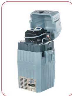
Mit Dosiersystem Schlauch- pumpe