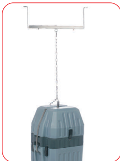
Verstellbarer Kanalbügel mit Aufhängegeschirr