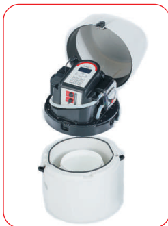
P6 MINI MAXX mit Sammelbehälter