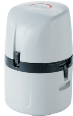
P6 MINI MAXX