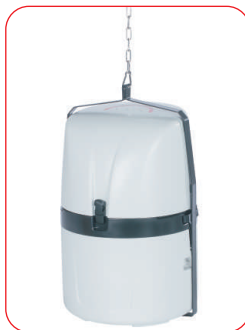
P6 MINI MAXX mit Aufhängeschirm