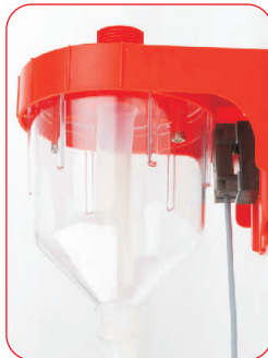
Berührungsloser Füllstands-sensor (Optional)