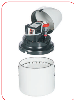
P6 L mit 24 x 1 L