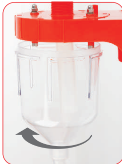
Dosiereinheit mit Bajonetverschluss