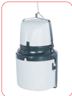
P6 L MAXX mit Aufhängeschirr (optional)