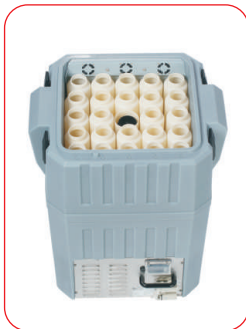
Aktive Kühlbox 12/115/230 V Ausführung 24 x 1 L