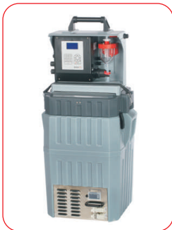
TP5 P mit Spannband auf aktiver Kühlbox