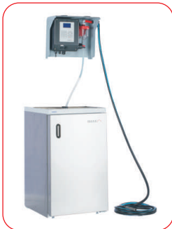
TP5 W in Kombination mit optionalem Kühlschrank 1 x 25 L